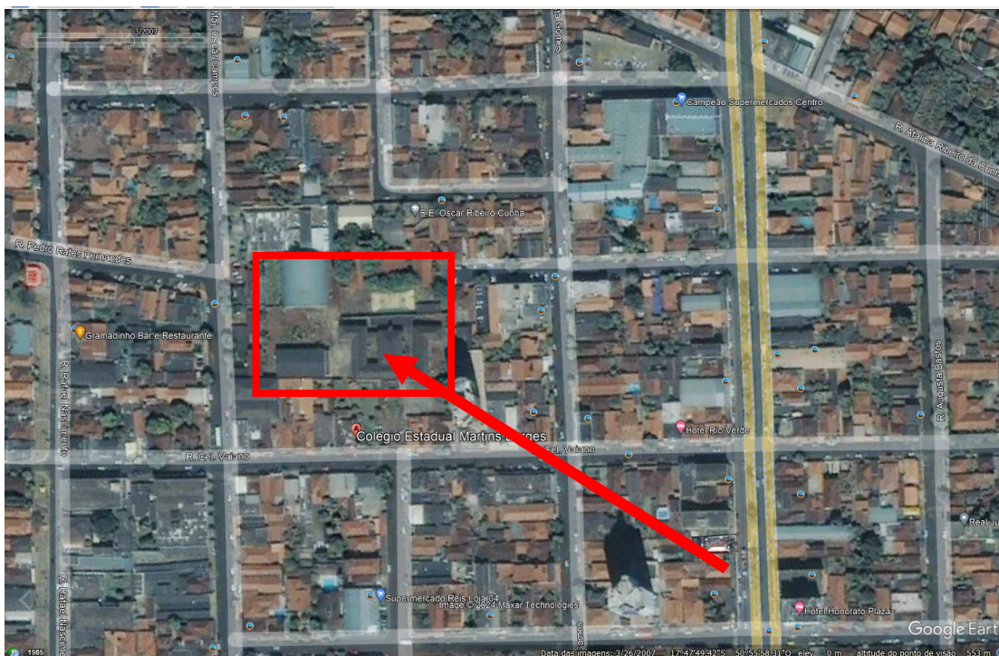
Foto Aérea – Data 03 de março de 2007 – Foto tirada do Google Earth.

Solicito a consideração para análise do projeto técnico mencionado acima, conforme previsto na NT-41/2019, que o enquadre em projeto existente anterior a 10 de março de 2007. Conforme Foto Anexada abaixo.